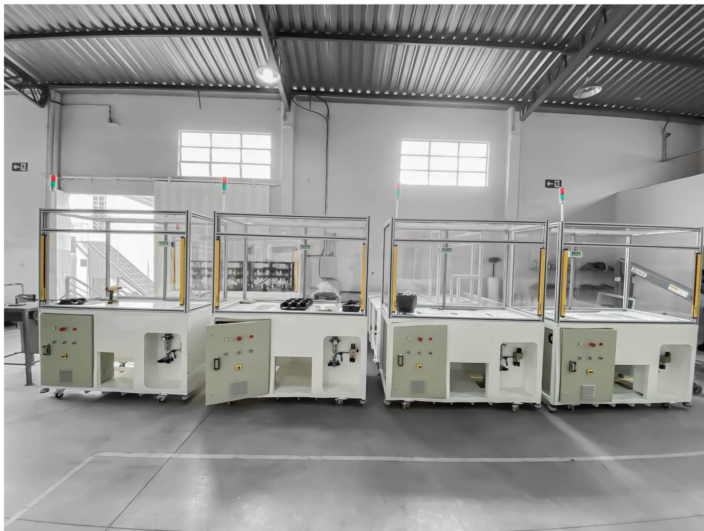
Máquinas sendo montadas.