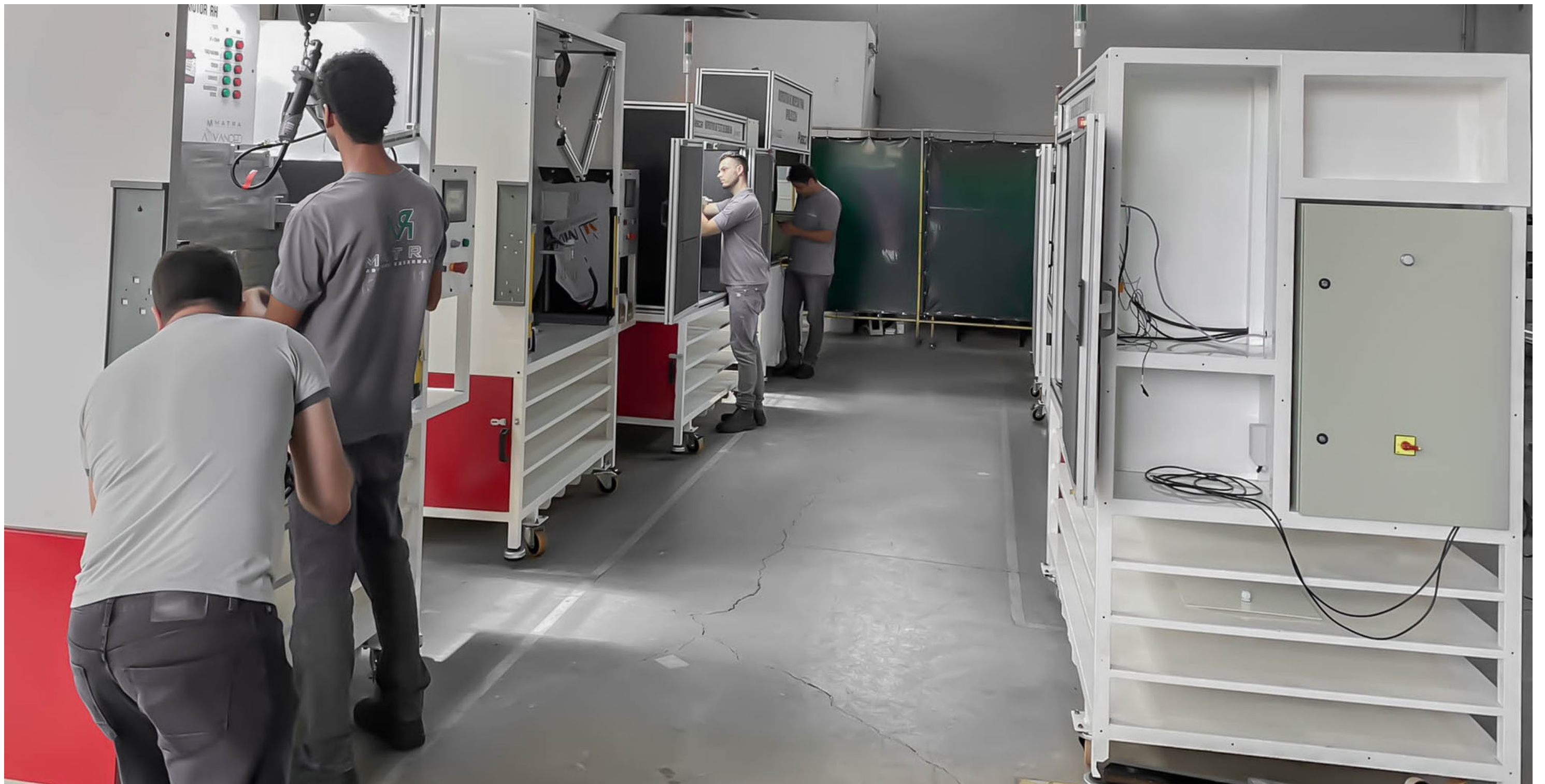
Máquinas sendo montadas e testadas.