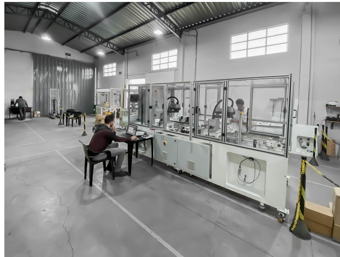
Programação de um dispositivo utilizando 2 robôs scaras .